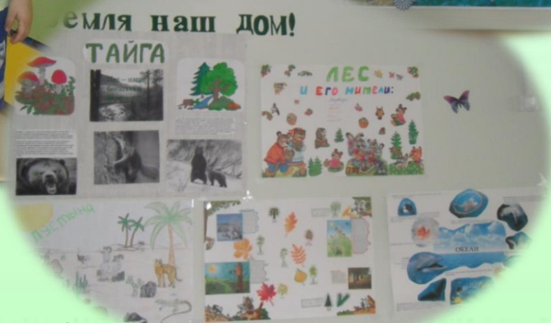
Газеты, информационные листы