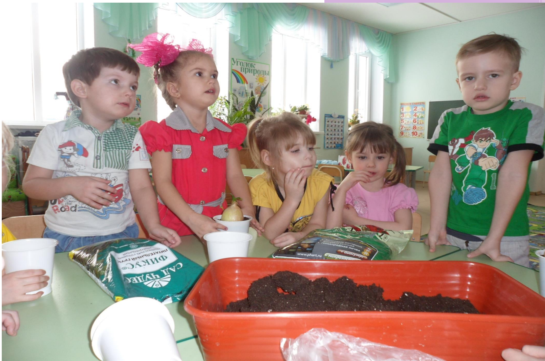
Рассматриваем почву, наполняем контейнеры для посадки.