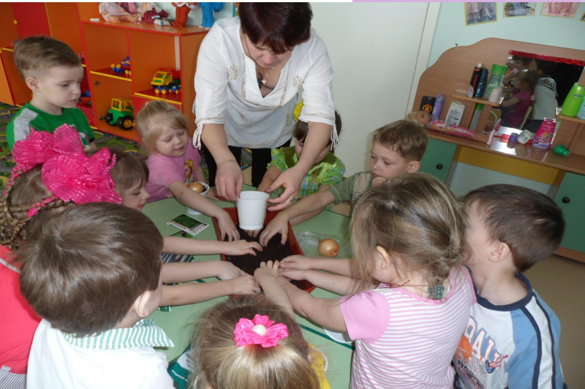
Какая мягкая и теплая землячка-кормилица