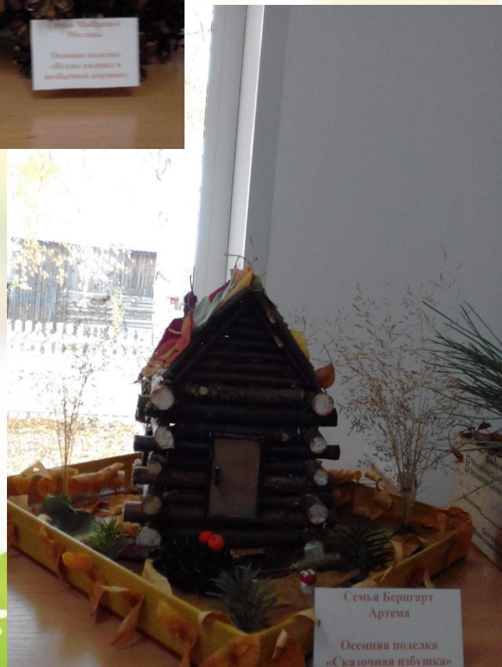
Семья Бернгард Артема Осенняя поделка «Сказочная избушка»